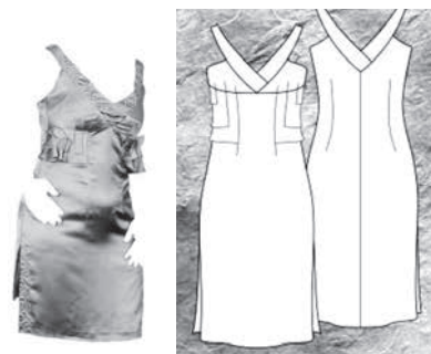
شکل ۴- دوخت نهایی مدل ارغوان

جنس این لباس ساتن و تور، به رنگ‌های قرمز و مشکی می‌باشد که رنگ قرمز نیز مورد استفاده‌ی صفویان بوده. خطوط عمودی که روی بالاتنه آمده اندام را کشیده تر نشان می‌دهد ولی یقه‌ی دراپه‌ی آن باعث پرتر جلوه دادن سینه‌ها می‌شود و برای افرادی که بالاتنه‌ی آن‌ها لاغر بوده مناسب است.