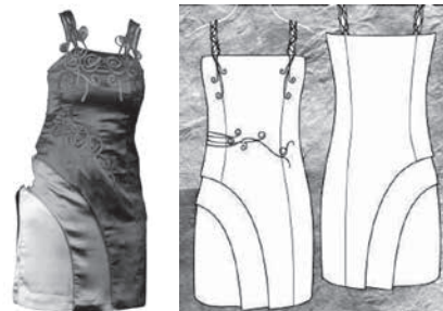
شکل ۳- دوخت نهایی مدل طرح روان

این لباس دکلمه می‌باشد که پارچه‌ای از جنس دیگر با نقوش پلنگی روی آن و دور بازوها قرار می‌گیرد بندی نیز یک طرف لباس وصل می‌شود قد لباس تا حدود زانو و یک پهلو دارای چاک است. مدل این لباس همان طور که از تزئینات و بند آن مشخص است برگرفته از نقوش اسلیمی می‌باشد. حریر نقش داری که در قسمت بالای لباس قرار گرفته و قسمت‌هایی از آن دارای پیلی‌های ریزی بوده الهام گرفته از دستار و شال کمر پوشاک صفویان بوده که باعث پرتر نشان دادن بالاتنه می‌شود. جنس این لباس از ساتن قهوه ای رنگ و حریر ابریشم به رنگ‌های سفید و قهوه ای می‌باشد.