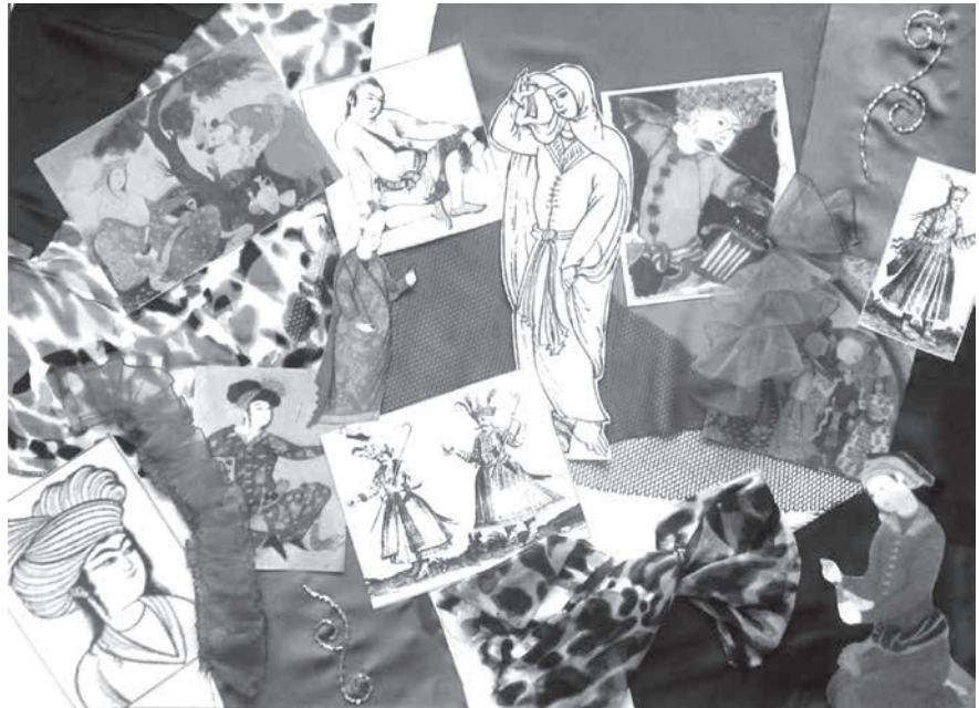
شکل ۱- استوری برد

این لباس متناسب سنین جوان است، قد آن تا حدود زانو، و یقه آن دکلته است. در بالا چند برش به صورت هفت منحنی و در پایین برشی به شکل گوده دارد. مدل این لباس همان طور که از ناحیه بالاتنه و در پایین لباس قسمت گوده مشخص است، چند لایه از حریر ارگانزا چین داده شده طبقه طبقه روی هم قرار دارد، که از چند لایه بودن لباس صفویه الهام گرفته شده است. برش‌هایی اریبی که روی بالاتنه قرار دارد فرد را چاق تر نشان داده و برای افراد با بالاتنه لاغر مناسب است. رنگ لباس بنفش و جنس آن ساتن بوده و حریر ارگانزا نیز به رنگ صورتی می‌باشد.