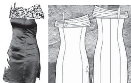
شکل ۷- دوخت نهایی مدل دراپه